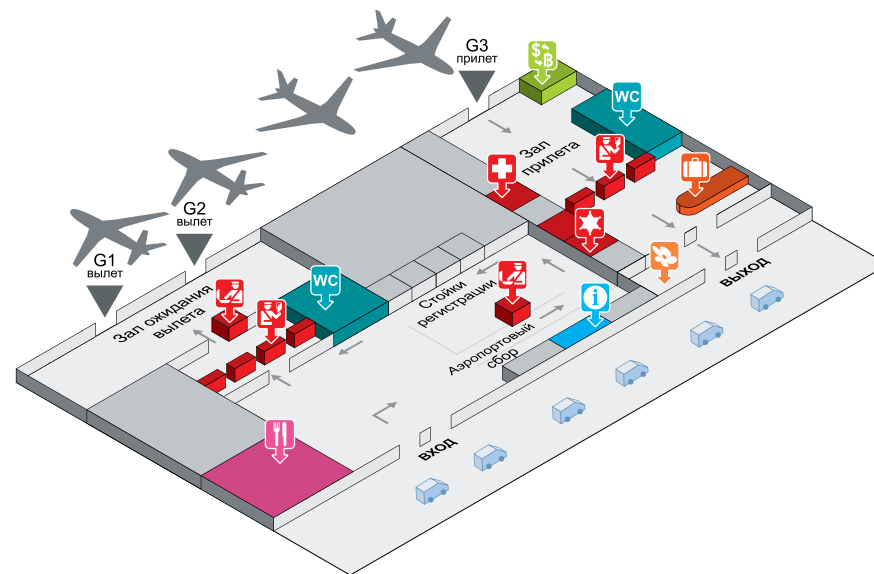
Рис. 9. План аэропорта Паттайи

Аэропорт Паттайи — У-Тапао — благодаря своим размерам также не оставляет возможности заблудиться или потеряться. Туристов встречают сразу за секцией получения багажа (рис. 9).