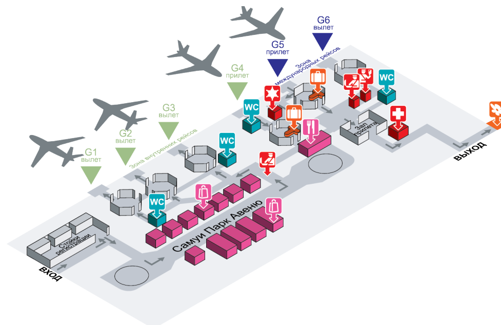
Рис. 7. План аэропорта Самуи

Туристов ждут в зоне, обозначенной как Meeting Point. Она находится в самом конце аллеи, по которой туристы выходят из секции получения багажа (рис. 7).