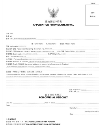
Образец заполнения анкеты для получения визы по прилету

Штраф за превышение допустимого для ввоза количества табачной и алкогольной продукции может составить до $800. Напоминаем также, что с 01.06.2007 запрещено проносить на борт самолета в ручной клади любые жидкости (духи, дезодоранты, лаки, лосьоны, воду, спиртное и т.п.) объемом больше 100 мл для каждого наименования. С 2017 г. на территории Таиланда строго запрещены ввоз, использование, хранение и ношение электронных сигарет и их аналогов, а также специальных жидкостей для этих устройств. Нарушителей ждет штраф и/или тюремное заключение сроком до 10 лет.