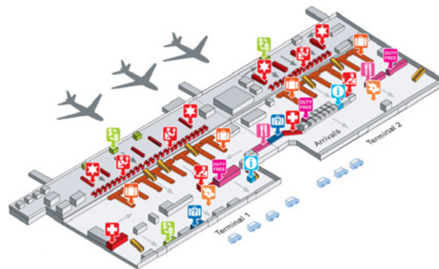
Рис. 4. План аэропорта Донмыанг