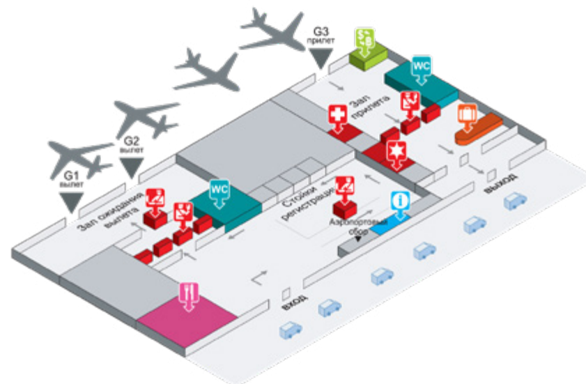
Рис. 9. План аэропорта Паттайи

Аэропорт Паттайи — У-Тапао — благодаря своим размерам также не оставляет возможности заблудиться или потеряться. Туристов встречают сразу за секцией получения багажа (рис. 9).