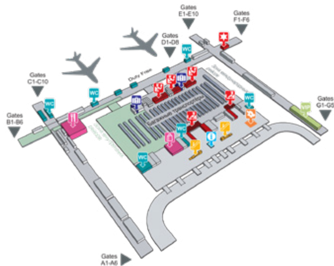
Рис. 3. План аэропорта Суварнабхуми

Туристов, прилетевших в аэропорт Донмыанг, встречают после получения багажа: пассажиров международных рейсов — на выходах 3 и 4 из здания аэропорта, внутренних рейсов — сразу по выходу из зоны багажных лент (рис. 4).