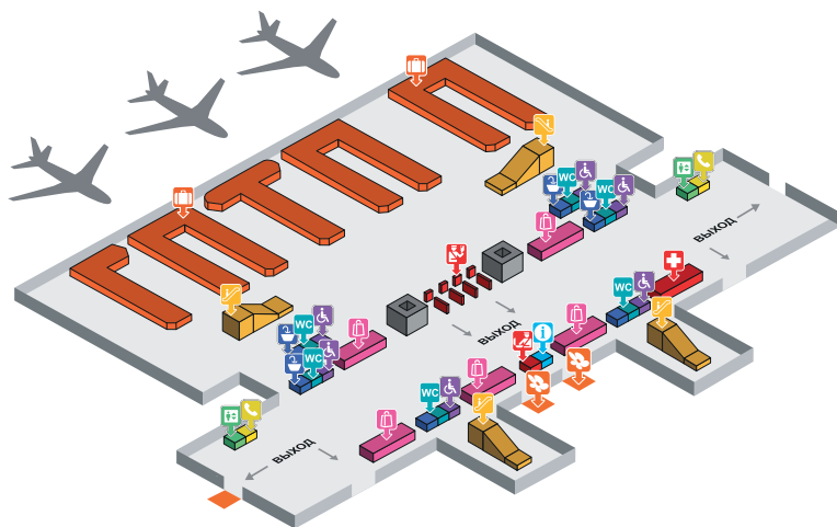
Рис. 5. План аэропорта Пхукета (International Terminal)

Туристов SAYAMA Travel встречают после получения багажа на выходе из здания аэропорта: пассажиров международных рейсов — на выходах 3 и 4 (рис. 5), внутренних рейсов — на выходе 1 (рис. 6).