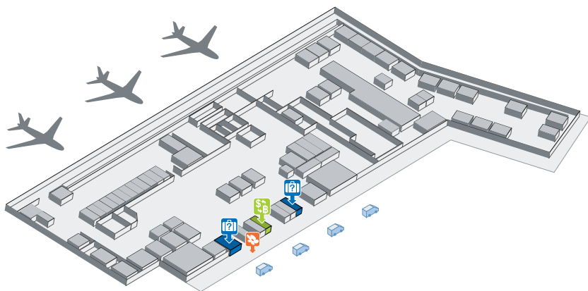
Рис. 6. План аэропорта Пхукета (Domestic Terminal)