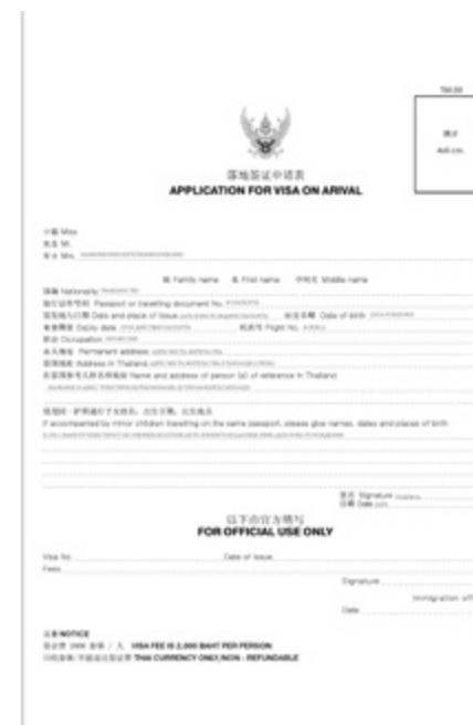
Образец заполнения анкеты для получения визы по прилету

По прилету в Таиланд туристам необходимо самостоятельно пройти паспортный контроль и зону таможи. До прохождения паспортного контроля следует заполнить иммиграционную карточку. Обычно ее выдают в самолете, но можно взять документ и непосредственно на стойке паспортного контроля. Заполняются обе части — на въезд и на выезд. Часть на въезд забирается контролером. Оставшуюся часть иммиграционной карточки важно сохранить для предъявления на паспортном контроле при выезде из страны.