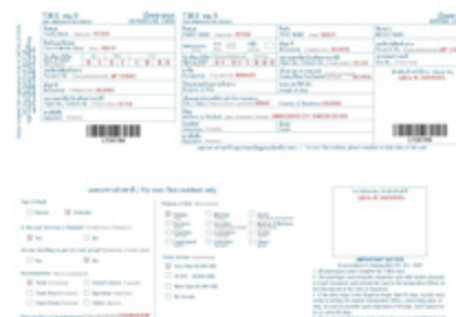
Образец заполнения иммиграционной карточки